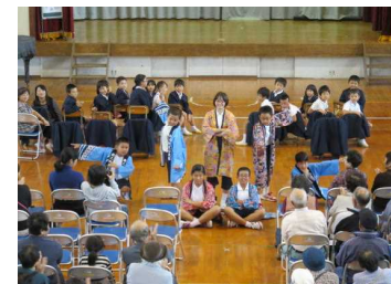
【ソーラン節もかっこよく】