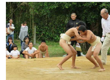
【6年生の力のぶつかり合い】