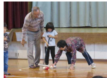
【ここをねらって打ってね】

みんな笑顔で一日を過ごすことができたことがよかったです。これからも、西野小学校の子どもたちの活躍を見守りください！御参加ありがとうございました。