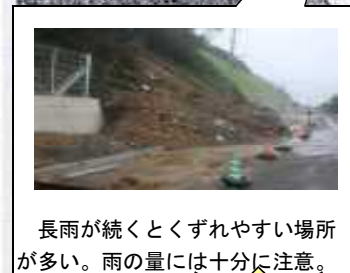
長雨が続きとくずれやすい場所が多い。雨の量には十分に注意。

いか・・・「いかない」 の・・・「のらない」 お・・・「大声でさけぶ」 す・・・「すぐにげる」 し・・・「知らせる」