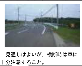
見通しはよいが、横断時は車に十分注意すること。