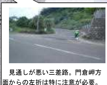
見通しが悪い三差路。門倉岬方面からの左折は特に注意が必要。