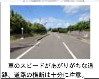
車のスピードがあがりやすい道路。道路の横断は十分に注意。