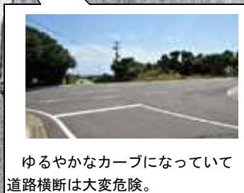
ゆるやかなカーブになっていて道路横断は大変危険。