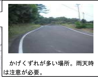
かけくずれが多い場所。雨天時は注意が必要。