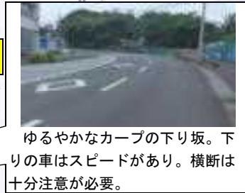
ゆるやかなカーブの下り坂。下りの車はスピードがあり。横断は十分注意が必要。