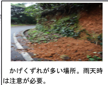
かけくずれが多い場所。雨天時は注意が必要。